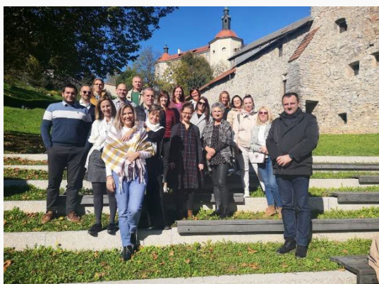
Škofja Loka: Sastanak partnera

Projektni partneri posjetili su dva kreativna centra koja djeluju u starogradskoj jezgri Škofje Loke u sklopu Razvojne agencije SORA. Centar za umjetnost i zanatstvo, te Kreativni centar Kreativnice uz Turističko informativni centar Škofja Loka čine kreativno središte koje će se dodatno opremiti sredstvima projekta kao rezultat projekta CCI4TOURISM.