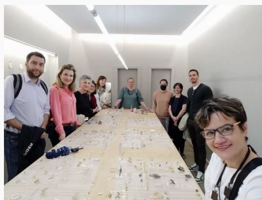
Središte Collective u Poru