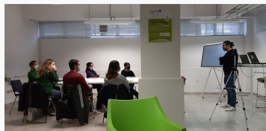
TNO Creative hub

Pojedinačna kreativna središta usmjerit će svoje napore u različitim područjima: različiti oblici digitalizacije turizma bit će u fokusu CIDEA-inog Creative Hub 78 (Banja Luka, Bosna i Hercegovina), KamRRA Hub' (Pivka, Slovenija), 3ANGLE Hub (Kaštel Novi, Hrvatska),