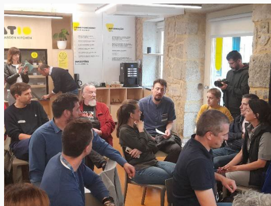
Učesnici studijskog putovanja