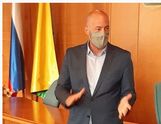
Gradonačelnik Škofje Loke Tine Radinja